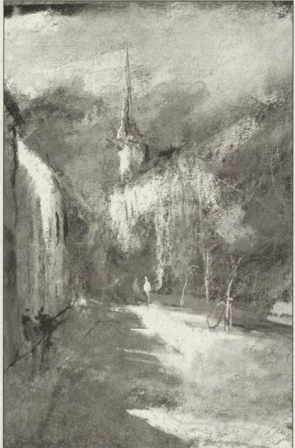
Tamási, ahogy a festő látta